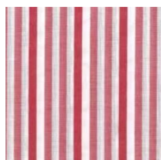
Art.Nr. 19846 burgund-67