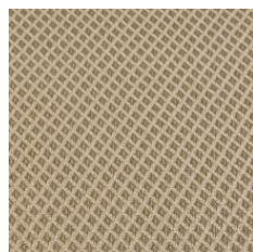
Art.Nr. 16657 912-beige