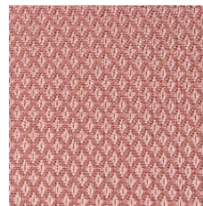
Art.Nr. 16657 217-grimy rose