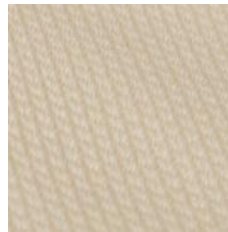
Art.Nr. 16657 001-ivory