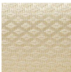
Art.Nr. 16657 003-asparagusivory