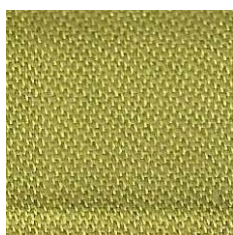
Art.Nr. 13862 limone