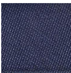
Art.Nr. 13862 dunkelblau