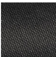
Art.Nr. 13862 braun