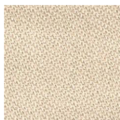
Art.Nr. 13862 sand