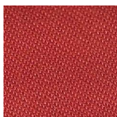
Art.Nr. 13862 orange