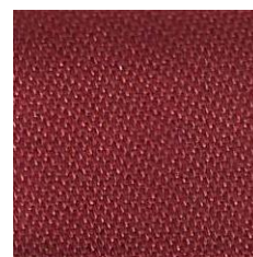
Art.Nr. 13862 ziegelrot