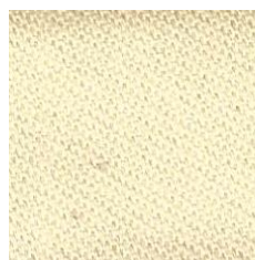
Art.Nr. 13862 sekt