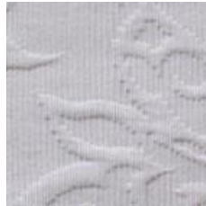
Art.Nr. 1164 Platin