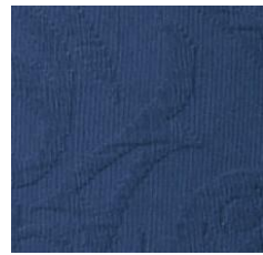
Art.Nr. 1164 Indigo