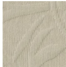
Art.Nr. 1164 Kit