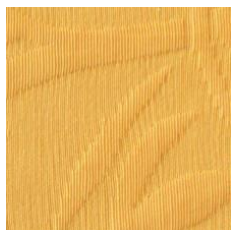
Art.Nr. 1164 Gold