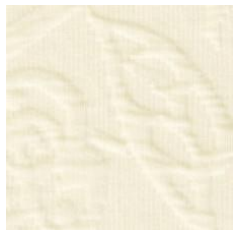
Art.Nr. 1164 Perle