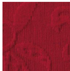
Art.Nr. 1164 Burgund