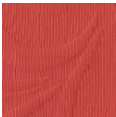
Art.Nr. 1164 Terracotta