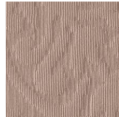
Art.Nr. 1164 Nougat