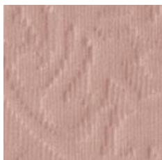
Art.Nr. 1164 Altrosa