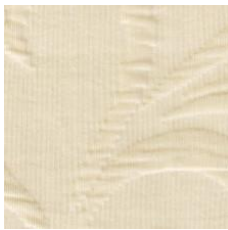
Art.Nr. 1164 Sand