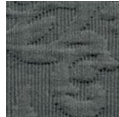
Art.Nr. 1164 Graphit