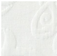
Art.Nr. 1164 Weiss