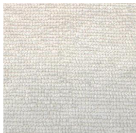
Art.Nr. 3121 gebleicht