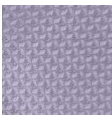
Art.Nr. 18436 violett