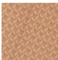
Art.Nr. 18436 lachs